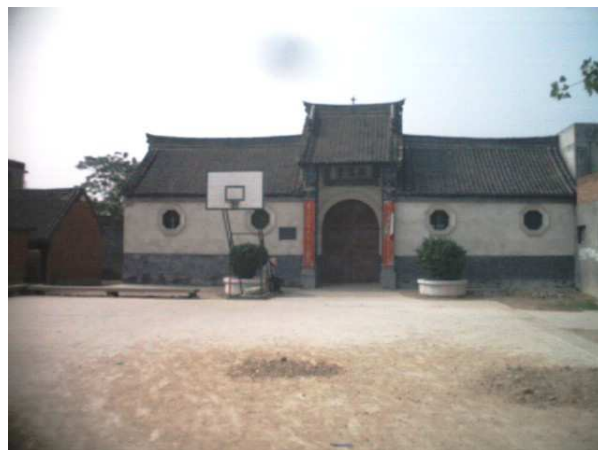
attuale residenza a Xiaozhuang